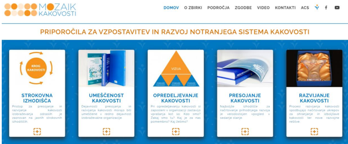
Slika 3.3: Spletna stran Mozaik kakovosti

kvantitativnih in kvalitativnih podatkov o nekem pojavu, procesu ali dosežku ter navodila za njihovo vrednotenje glede na postavljene standarde kakovosti. Spletni portal nam služi kot pripomoček za strokovno delo na vseh vidikih notranjega sistema kakovosti (opredeljevanje, presojanje in razvijanje kakovosti). Do njega dostopamo na spletni povezavi https://mozaik.acs.si .