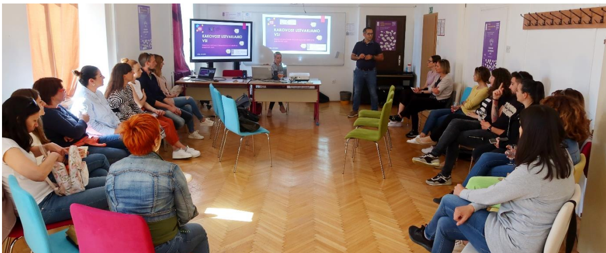
Slika 4.2: Zgledovalni obisk LU Postojna na LU Celje

Članstvo v ZLUS pomembno prispeva k našemu strokovnemu delu, k uvajanju novosti in razvoju kakovosti v dejavnostih Ljudske univerze Celje.