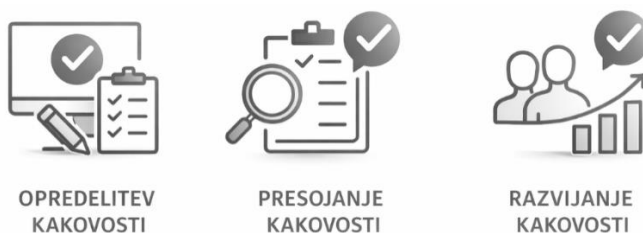
Slika 1.1: Infografika kakovosti