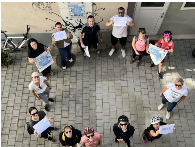
Slika 2.1: Dan kakovosti, 2025

Opis: Delo Ljudske univerze Celje vodijo nekatere temeljne vrednote, kot so strokovnost, odgovornost, profesionalnost, spoštovanje, veselje do dela, usmerjenost v mednarodno sodelovanje idr. V letu 2022 smo znova premislili in dopolnili temeljne vrednote, ki usmerjajo naše ravnanje. Vrednot nismo samo zapisali, temveč smo tudi opredelili, kako jih zaposleni razumemo. Vrednote so zapisane na spletni strani Ljudske univerze Celje ( https://www.lu-celje.si/o-nas/vizija-poslanstvo-vrednote ). Z njimi seznanjamo udeležence izobraževanja odraslih, financerje, partnerje in druge uporabnike naših storitev. Občasno jih objavimo v našem katalogu, brošurah ali drugih strokovnih publikacijah.