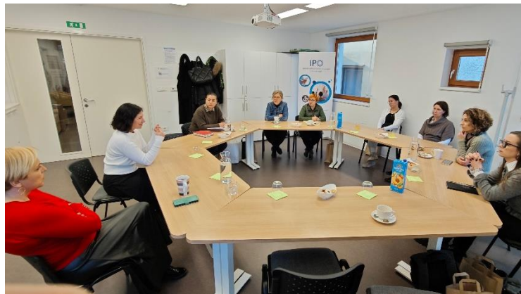
Slika 3.2: Zgledovalni obisk na LU Ajdovščina

Zgledovalni obisk je namenjen učenju iz dobrih praks, ki so jih razvile druge izobraževalne organizacije. Izvedemo ga tako, da vnaprej pripravimo natančen načrt, ki določa, kaj bo predmet obiska in v katera področja želimo dobiti vpogled. Na podlagi tega izberemo izobraževalno organizacijo in se dogovorimo za zgledovalni obisk. Analiza ugotovitev služi kot podlaga za uvedbo izboljšav v našem delu. Zadnji zgledovalni obisk smo izvedli 14. 1. 2025 na Ljudski univerzi Ajdovščina.